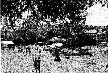
L'initiative se fait dans le respect de l'environnement.

en-Vercors, cette initiative s'est poursuivie en 2010 à Saint-Martin en Vercors, en 2011 à Saint-Agnan-en-Vercors, en 2012 à